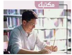
خدمة خاصة بموظفي النهار